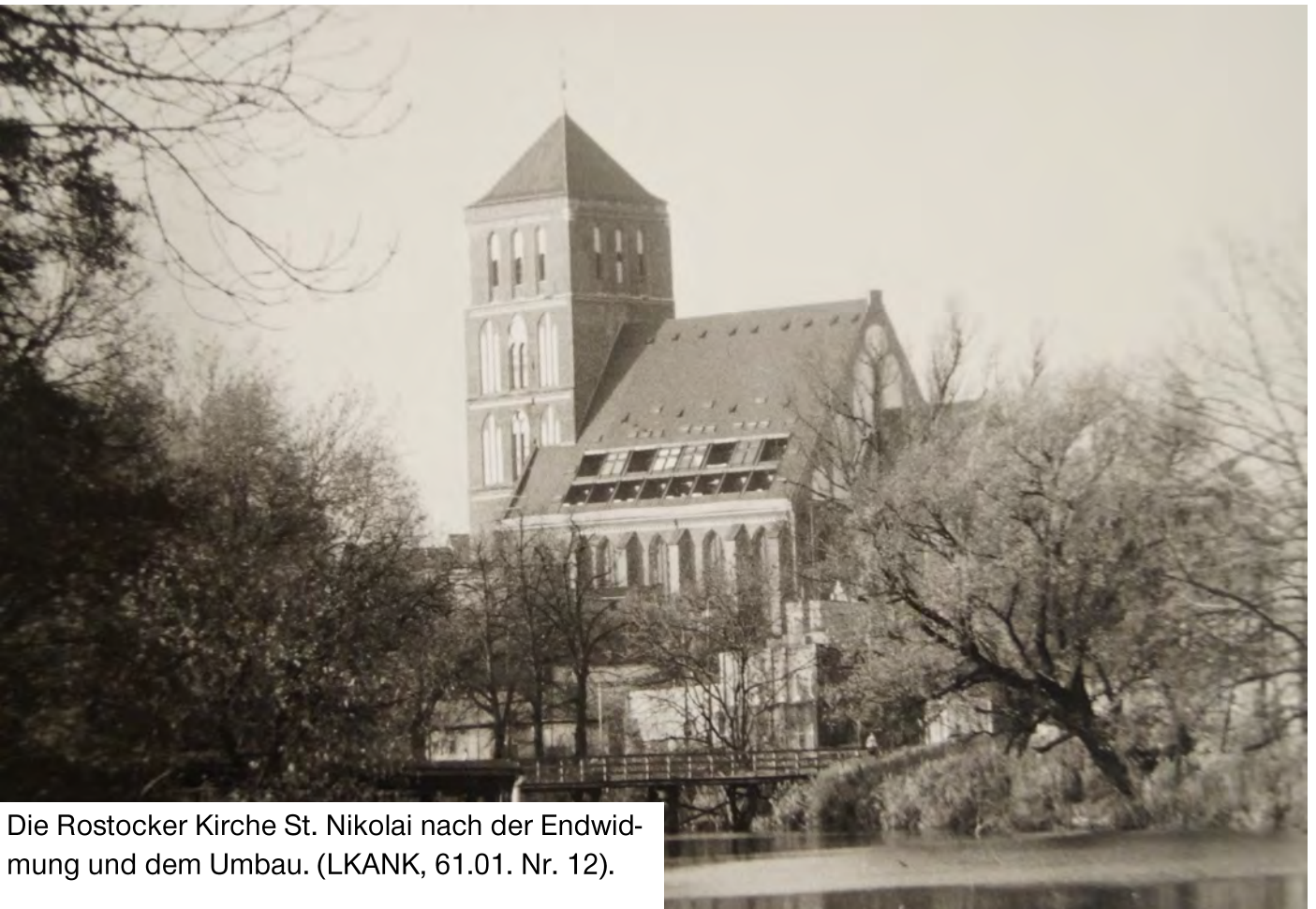
Die Rostocker Kirche St. Nikolai nach der Endwidmung und dem Umbau. (LKANK, 61.01. Nr. 12).

Mittels guter Planung im Archiv und neuer Arbeitsverfahren vor Ort konnte dieses Unterfangen erfolgreich mit kleinerem Personalaufwand als in der Vergangenheit durchgeführt werden. Zudem gab es großartige Unterstützung im Dorothee-Sölle-Haus selbst. So wurden im Dezember die Akten durch das Archiv übernommen, kurz bevor alle ausziehen mussten.