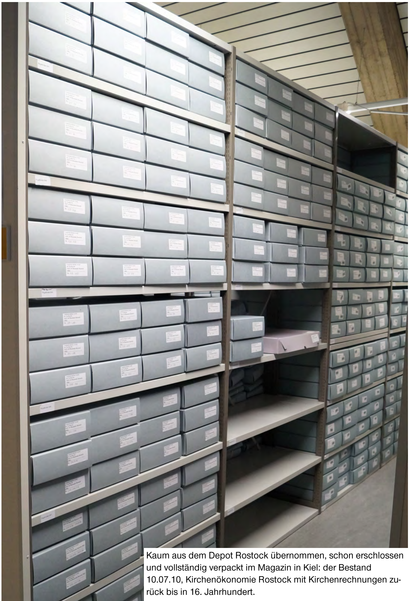
Kaum aus dem Depot Rostock übernommen, schon erschlossen und vollständig verpackt im Magazin in Kiel: der Bestand 10.07.10, Kirchenökonomie Rostock mit Kirchenrechnungen zurück bis in 16. Jahrhundert.