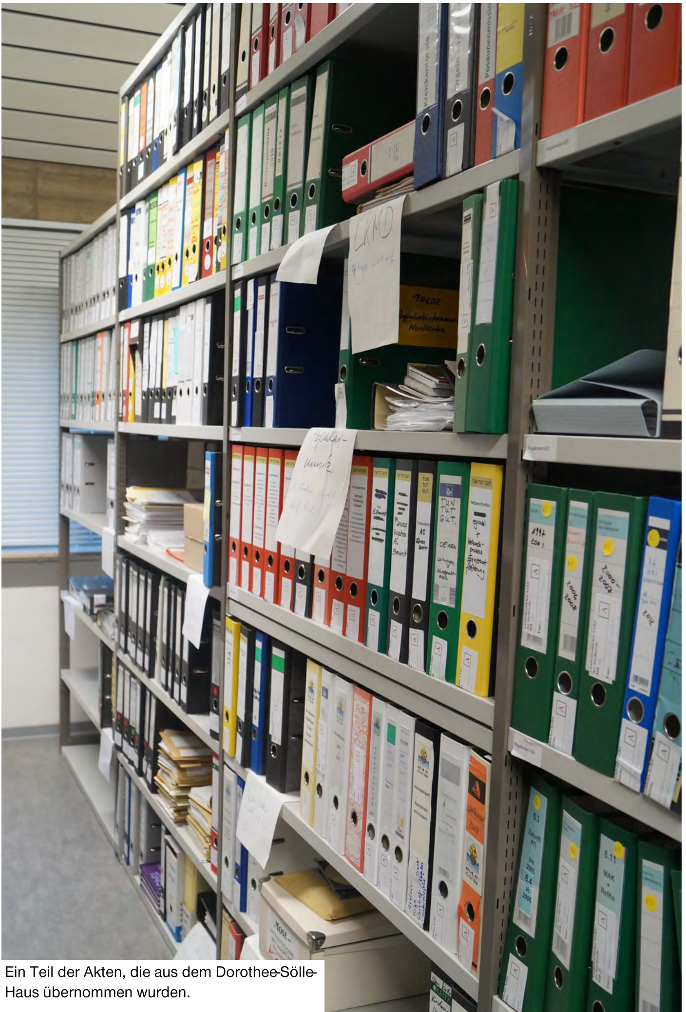
Ein Teil der Akten, die aus dem Dorothee-Sölle-Haus übernommen wurden.