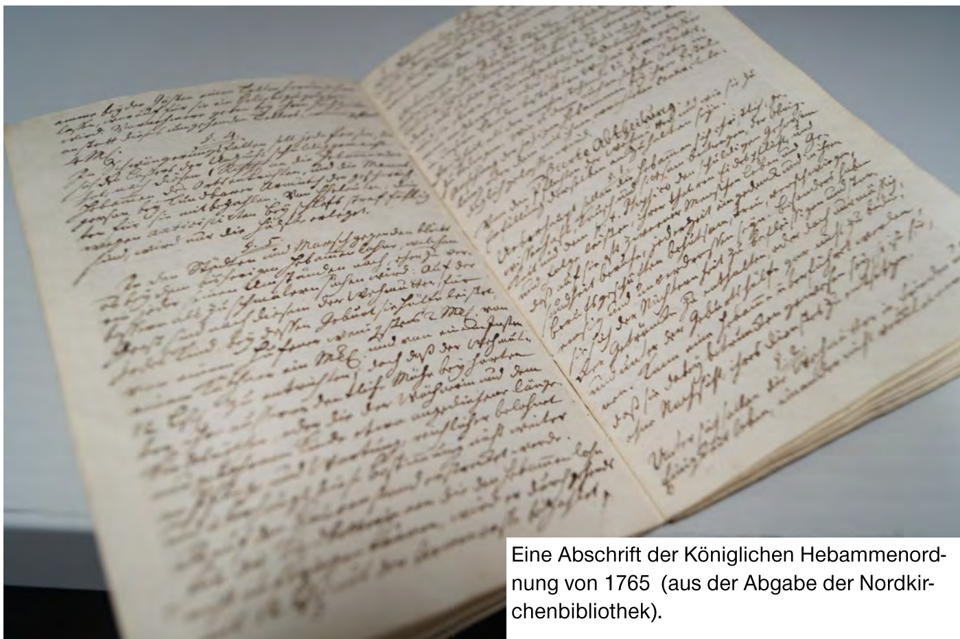
Eine Abschrift der Königlichen Hebammenordnung von 1765 (aus der Abgabe der Nordkirchenbibliothek).